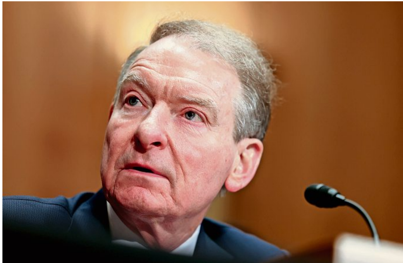
Die Genehmigungsverfahren auf dem Pult des Chefs der US-Börsenaufsicht SEC, Paul Atkins, stapeln sich.

Nach Solana stehen nun Cardano und XRP bezüglich einer ETF-Zulassung im Fokus der Anleger. Beide Coins gelten als aussichtsreiche Kandidaten. Die ETF-Beobachter Seyffart und Balchunas erachten eine Genehmigung sogar für gesetzt. Die politische Grosswetterlage scheint günstig: Präsident Donald Trump hatte beide Kryptowährungen im Zuge seiner Ankündigung einer Krypto-Staatsreserve erwähnt. Zudem sind Cardano und XRP im Markt für digitale Assets fest etabliert.