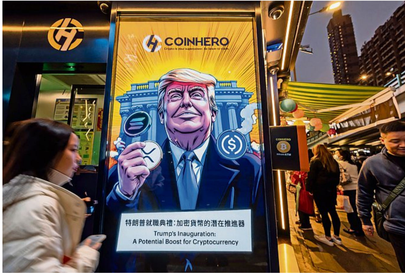
Donald Trump bewegt den Kryptomarkt mit wenigen Tastenschlägen über sein Sprachrohr, die Social-Media-Plattform «Truth Social».

Solana befindet sich in dieser Rangliste auf Rang sechs, zwei Plätze vor Cardano. Bei beiden handelt es sich um Smart-Contract-Blockchains sowie um Nachfolger und Konkurrenten von Ethereum. Smart Contracts sind Verträge bzw. Programme auf Blockchains, deren Vertragsbedingungen hinterlegt sind und die automatisch und ohne menschliche Eingriffe ausgeführt werden. Für solche Smart Contracts gewährten Solana und Cardano die nötige Infrastruktur an, sagt Höchle: «Sie bieten Entwicklern die Möglichkeit, selbstaus-