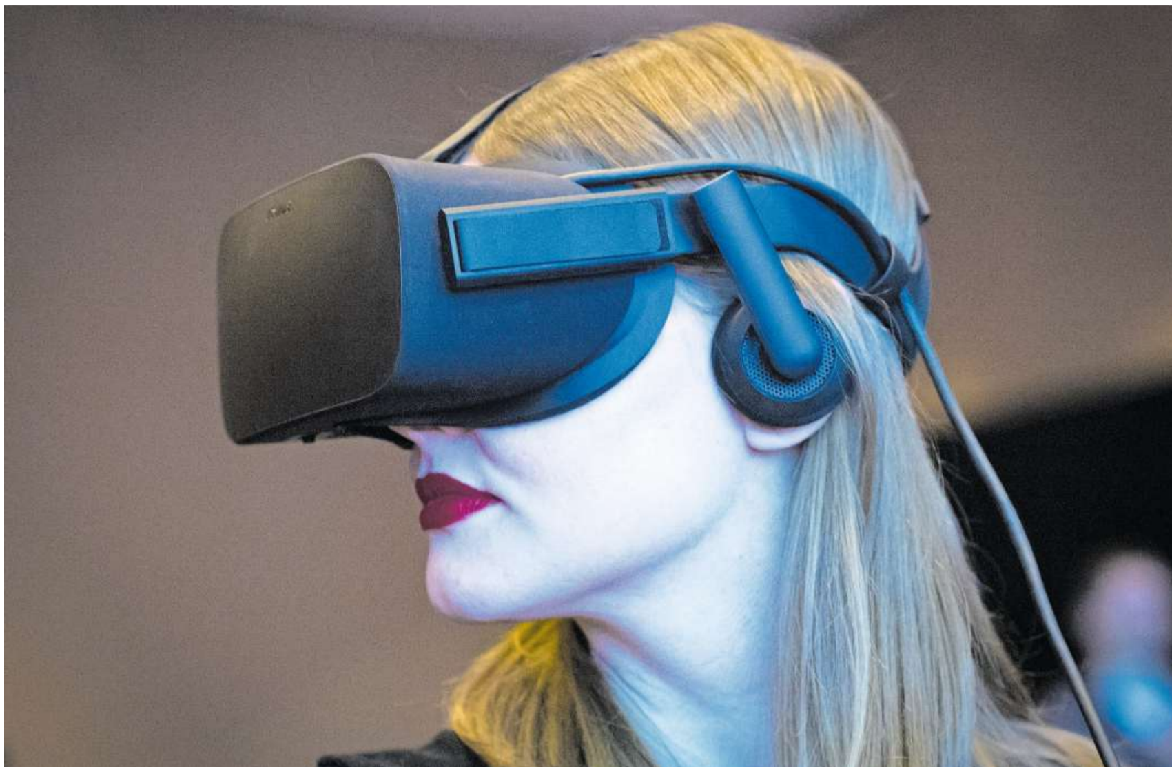
Je erfolgreicher die künstliche Intelligenz, desto mehr Konzerne profitieren: Besucherin an einer Medienkonferenz des Tech-Unternehmens Intel.